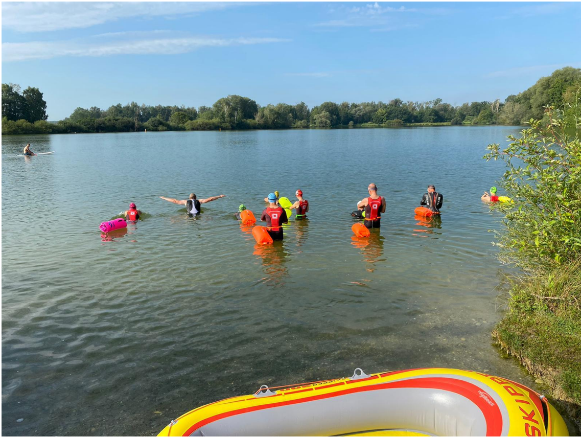
Vor dem Startschuss