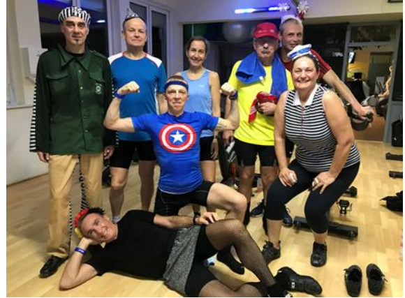
Indoor Cycling am „rußigen Freitag“