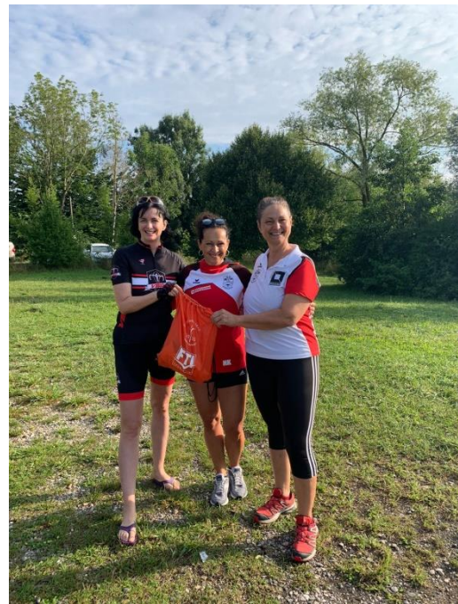
Am Start auch eine Damenmannschaft