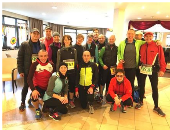
Gruppenbild mit weiteren Läufern aus Günzburg

Indoor Cycling sowie Funktionsgymnastik konnte bis zum 13. März durchgeführt werden. Anschließend kam der erste Lockdown und damit gewaltige Einschnitte in Trainingsangebot. Trainiert wurde unter den jeweiligen Corona Bedingungen, meistens in Kleingruppen oder mit Abstand. Wettkämpfe wurden alle gestrichen.